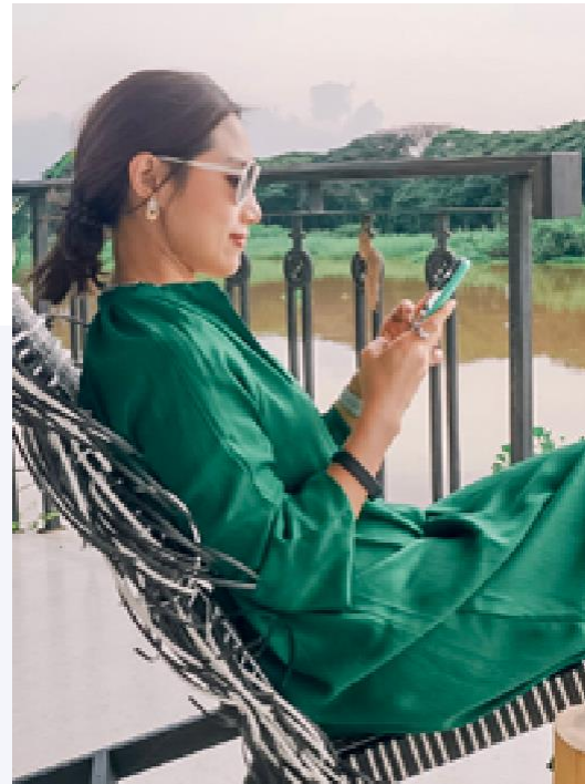
NUCHE(タイ) アムウェイ会員(ABO)歴19年

「ABOになって良かったことは、どこで、どのよう に、誰と働くかを自由 に選べる ことです。あ らゆる形の自由があります。」