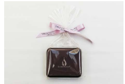
低糖質チョコレート

会場には、糖化の進行具合の目安として体内の AGEs を測定できるセンサーを設置、また、インスタ映える華やかなフォトブースも設置され、ご来場の皆様にお楽しみいただける空間が演出されていました。