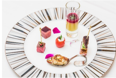
低糖質食材を使った特製カナッペ