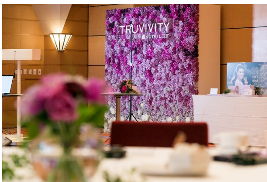
華やかなフォトブース

会場には、糖化の進行具合の目安として体内の AGEs を測定できるセンサーを設置、また、インスタ映える華やかなフォトブースも設置され、ご来場の皆様にお楽しみいただける空間が演出されていました。