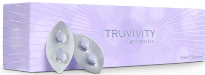
トゥルーユース™ サプリメント

その他、低糖質チョコレートや、糖化のメカニズムに着目して開発された「TRUVIVITY™ トゥルーユース™」の美容サプリメントと美容パウダードリンクをお土産としてお持ち帰りいただきました。