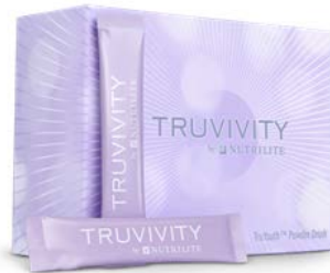
トゥルーユース™ パウダードリンク