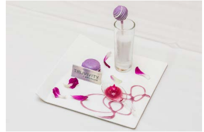
TRUVIVITY™ トゥルーユース™ のパウダードリンクを使用したスペシャルデザート

その他、低糖質チョコレートや、糖化のメカニズムに着目して開発された「TRUVIVITY™ トゥルーユース™」の美容サプリメントと美容パウダードリンクをお土産としてお持ち帰りいただきました。