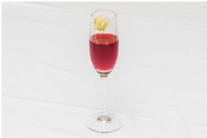
TRUVIVITY™ トゥルーユース™ のパウダードリンクを使用したスペシャルドリンク

当日は参加者の皆様に、東京アメリカンクラブ特製の低糖質の軽食やデザート、特製ドリンクがふるまわれました。