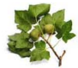
クワイシードオイル

プロビタミン B5： 保湿成分。髪表面をコートし、なめらかに整える。うるおいを与え、輝きをもたらす。